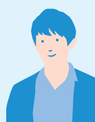
鹿児島県出身の N.T.さん

地域や九州・山口の生活に興味がある人は参加してみると良い人生経験になると思う。また、行きたい業界が決まっていれば、東京と地域の会社がどう違うかを比較できるので将来を考える上で役に立つと思う。