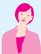
東京都出身の M.S.さん

地域や九州・山口の生活に興味がある人は参加してみると良い人生経験になると思う。また、行きたい業界が決まっていれば、東京と地域の会社がどう違うかを比較できるので将来を考える上で役に立つと思う。